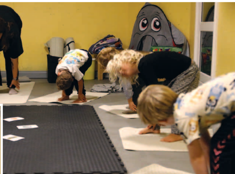
Dyr kan bruges i børneyoga til at gøre øvelserne mere levende for børnene. Her skal børnene forestille sig, at deres ben er tunge som en elefants.

Nogle øvelser passer ikke til alle aldersgrupper. Her skal børnene samle stofkugler op med deres tæer. Det er en øvelse, der stiller krav til motorikken, og som er for svær til vuggestuebørn.